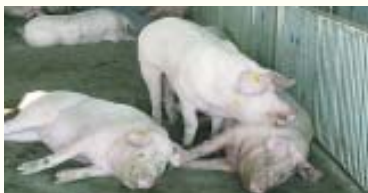
การขังแม่สุกรรวมกัน

6.2 หลังคลอด 1-3 วัน ควรให้อาหารแม่สุกรแต่น้อย (วันละ 1-2 กิโลกรัม) และเพิ่มขึ้นเรื่อยๆ จนให้อาหารเต็มทีเมื่อหลังคลอด 14 วัน (ให้อาหารวันละ 4-6 กิโลกรัม) หรือหากแม่สุกรมีลูกเกิน 10 ตัวขึ้นไป อาจจะให้ให้อาหารแม่สุกรเลี้ยงลูก 8-10 กิโลกรัมต่อวัน หลังจากคลอด 14-28 วัน หรือจนกระทั่งแม่สุกรหย่านม ระวังอย่าให้แม่สุกรพอมเมื่อหย่านม ซึ่งจะมีผลทำให้แม่สุกรไม่สมบูรณ์พันธุ์ และโทรมมาก แม่สุกรหลังหย่านมควรขังรวมกันคอกละประมาณ 2-5 ตัว