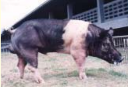
สุกรพันธุ์แฮมเชียร์

ส่วนสุกรลูกผสมที่ผลิตเป็นสุกรขุน นิยมใช้สุกรสามสายพันธุ์คือ ดูริอคเจอร์ซี่ x แลนด์เรซ-ลาร์จไวท์ (โดยใช้พ่อพันธุ์แท้ดูริอคเจอร์ซี่ และแม่ลูกผสมแลนด์เรซ-ลาร์จไวท์)