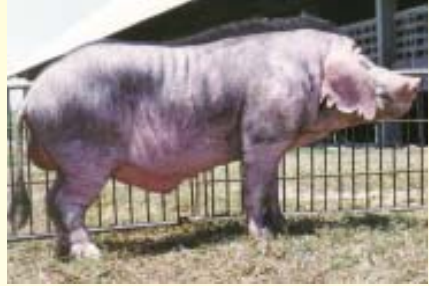
สุกรพันธุ์เหมยซาน