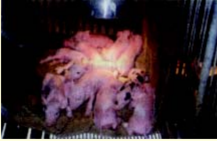
ไฟกกลูกสุกร