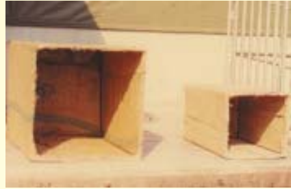
กล่องกระสอบ

3.4 รีบนําลูกสุกรกินนมน้ำเหลือง จากเต้านมแม่สุกร ในนมน้ำเหลืองจะมีสารอาหาร และภูมิคุ้มกันโรค ปกติในนมน้ำเหลืองจะมีอยู่ ประมาณ 36 ชั่วโมง หลังคลอด จากนั้นจะ เปลี่ยนเป็นนํานมธรรมดา